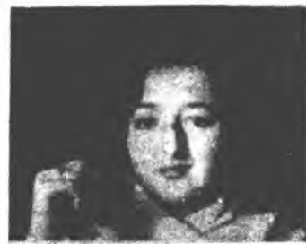
Студентка — педагог

Дзвоніть, пишіть, заходьте: м.Івано-Франківськ, вул.Шевченка, 57, 2-й поверх, каб. 209, 207а, тел.: 9-64-41, 9-64-13;